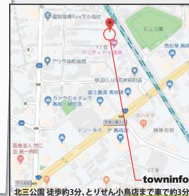
北三公園 徒歩約3分、とりせん小島店まで車で約3分