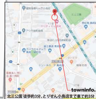
北三公園 徒歩約3分、とりせん小鳥店まで車で約3分 towninfo.