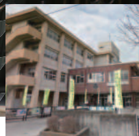
西小学校 約450m/徒歩約6分