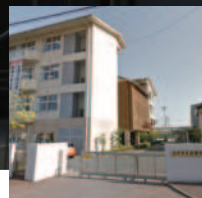
並榎中学校 約95m/徒歩約2分