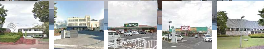
東小学校 約1.3km/徒歩約16分 北中学校 約1.7km/徒歩約21分 フレッシュ大泉店 約190m/徒歩約2分 ダイソー 約190m/徒歩約2分 大泉文化むら 約450m/徒歩約5分