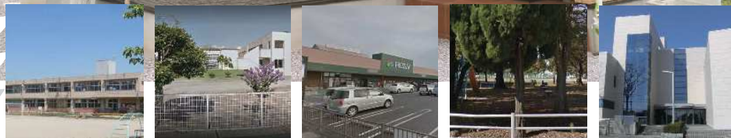
坂東小学校 約400m/徒歩約4分 第四中学校 約1100m/徒歩約14分 フレッシュセイ富塚店 約600m/車約2分 除ヶ4号公園 約250m/徒歩約3分 伊勢崎市民プラザ 約600m/車約2分