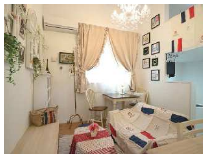
【フレンチカントリーインテリア】