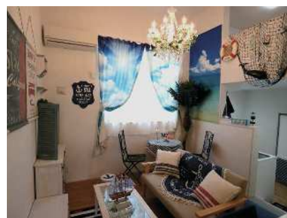
【エーゲ海マリンインテリア】